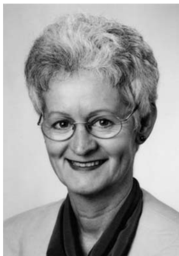
Pia Hollenstein, St. Gallen Nationalrätin (Grüne/SG)

Seit Jahren forciert die Betreiberin des Flugplatzes Altenrhein den Ausbau ihrer Verkehrsinfrastruktur. Die zusätzliche Lancierung einer Umfrage in der regionalen Wirtschaft deutet auf einen weiteren Ausbau hin.